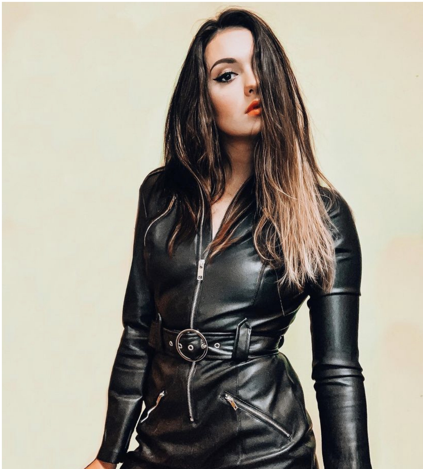
Ez akár címlapfotó is lehetne.

Jelenleg a Pázmány Péter Katolikus Egyetem harmadéves hallgatója vagy jogász szakon. Mivel szeretnél foglalkozni majd az aktív sportévek után? Mennyire tudod összeegyeztetni a tanulást a sportolással?