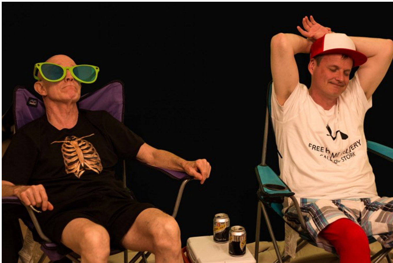
A Halál és a Gólya a tengerparton