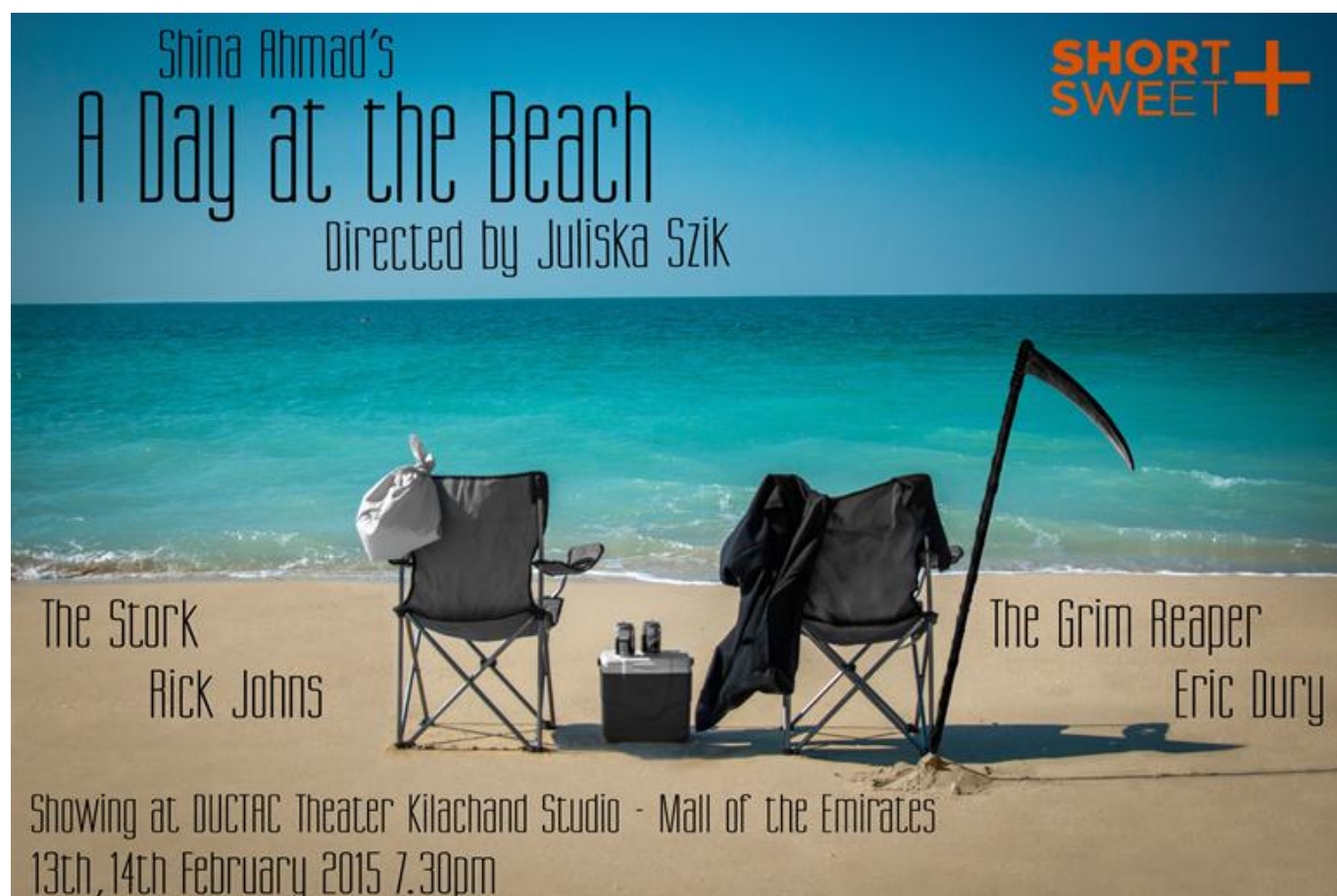
A "Day at the Beach" plakátja

tönkreteszi a szabadnapjukat. Fölmerül az erkölcsi kérdés, hogy akkor most mitévők legyenek, kötelességük-e még ilyenkor is gondoskodni a haldoklóról? Ha igen, melyikük feladata? És mi a valódi motivációjuk, hogy ezt még az évszázad egyetlen szabadnapján is megtegyék?