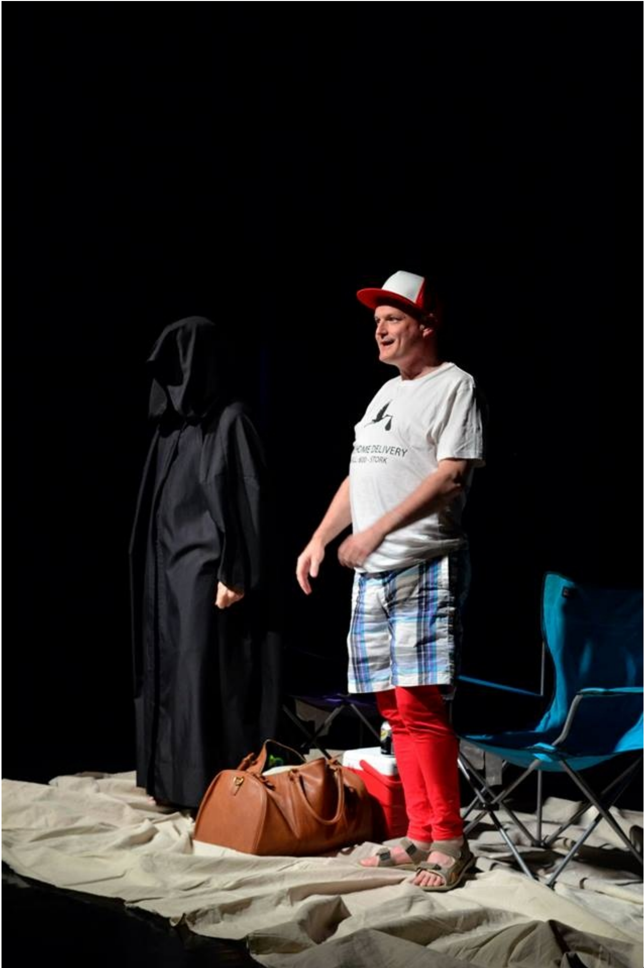
Gólya és a Kaszás egy "cégnél" dolgozik, vagy mégse?